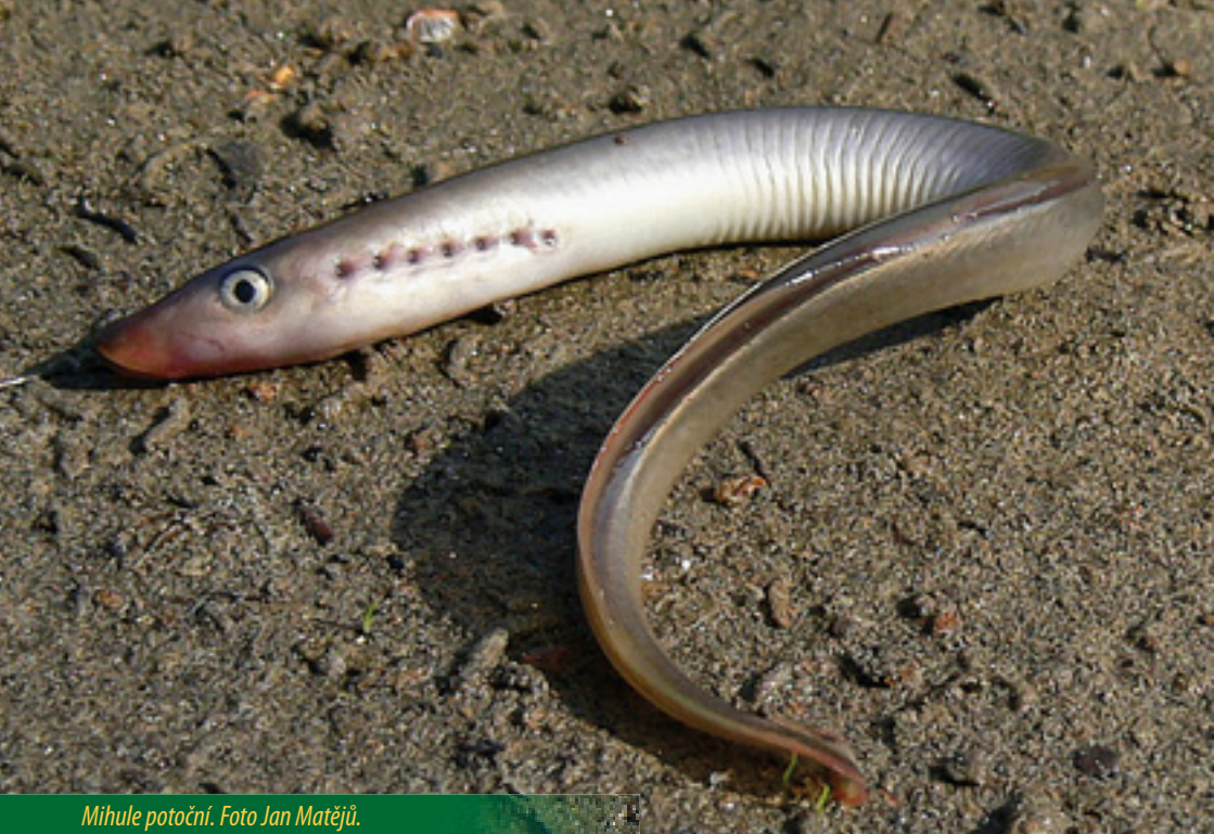
Mihule potoční.